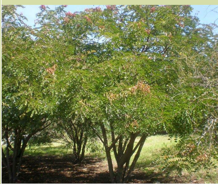
Árbol de Tara Caesalpinia spinosa