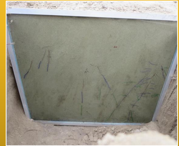
Rizotrones con raíces de vid.